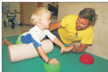
Eerst oefenen de therapeut en de patiënt in een speciale behandelkamer.