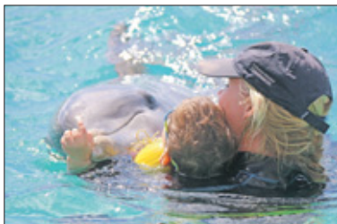
De therapeut en de patiënt werken aan oefeningen die het leven van de patiënt zullen vergemakkelijken.