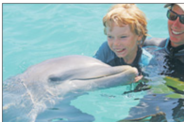
Zo'n 85 procent van de patiënten zijn kinderen met onder andere het Down-syndroom, autisme, cerebrale parese of meervoudige handicaps. De dolfin