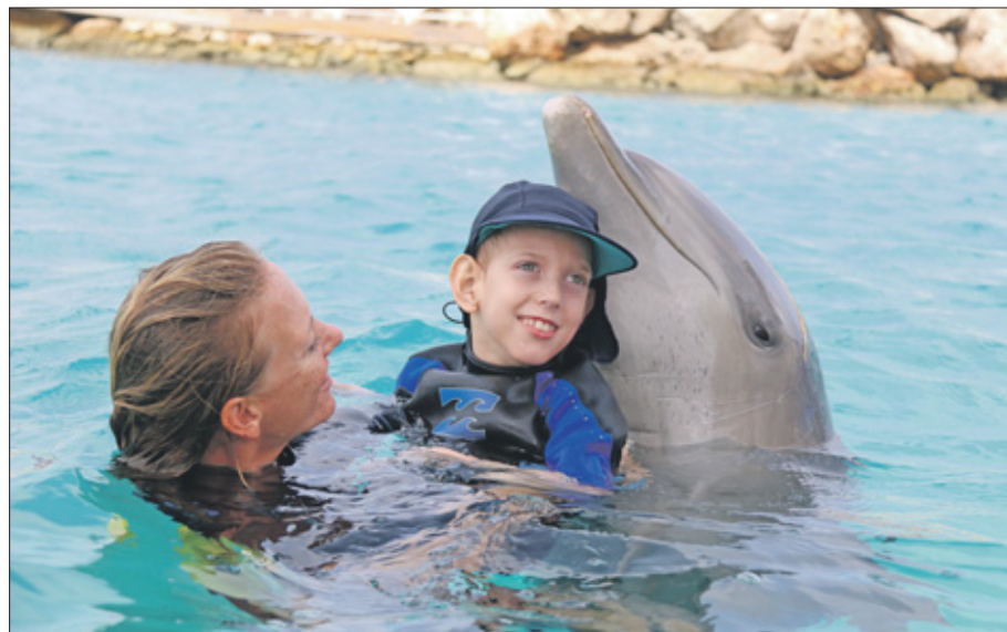
Tijdens de therapie staat centraal dat het kind en de therapeut interactie hebben met elkaar en met de dolfin samenwerken.

Dit alles zorgt ervoor dat zo'n 70 procent van de gezinnen weer terugkeert naar CDTC; een totaalplaatje van betrokken therapeuten, enthousiaste trainers en natuurlijke 'kracht' van de dolfinen om mensen met een beperking een stuk meer verlichting en vrijheid te geven.