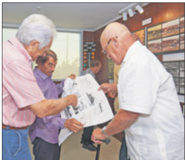
Drie bezoekers hebben het over de start van dragraces in 1968.