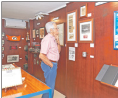
Het gedeelte van het museum waar hillclimb en gocart te vinden is.