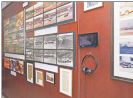
Foto's en oude krantenberichten van het dragraces in de periode 1970-1980.