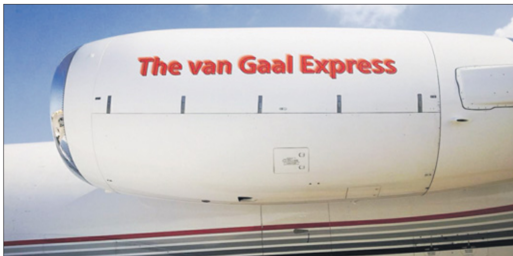
'The Van Gaal Express' vliegt vandaag door naar Brazilië.

sturen cijfers aan de minister overhandigen om de impact van de maatregelen te illustreren. De schoolbesturen hebben op vrijdag weer een overleg met de minister. Afhankelijk van wat daaruit voortvloeit zal Sitek actie voeren om ook tegen de bezuinigingen in het vervolgonderwijs te protesteren. De acties van deze week staan voorlopig alleen in het teken van de juridische positie van de leerkrachten.