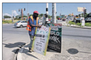
Op de foto's een impressie van de werkzaamheden.

den laten maken met reclame om binnen enkele weken te verspreiden over het eiland.” Pleasure Events is van mening dat de regering in België bijvoorbeeld alternatieven biedt, zoals plakborden waar je gratis affiches kan plakken, grote kaders of billboards die via de gemeente te huur zijn. „Zolang er geen alternatieven zijn, zie ik het nut er niet van in dat het verboden wordt, omdat het de toeristische zaken zijn die de borden neerzetten. Voor ons is het ook moeilijk om op een andere manier op het eiland reclame te maken.”