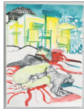
'Nog geen titel', schets, 2017, David Bade.