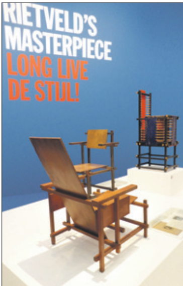
De eerste stoelen van Gerrit Rietveld.