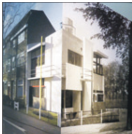
Het Rietveld Schröderhuis, Prins Hendriklaan 50, Utrecht.