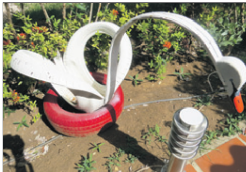
Een van de zwanen in de tuin van Rancho Sobrino.

klik tussen ons. In haar heb ik gezien, dat wij samen meer kunnen presteren, speciaal op artistiek gebied. Wij zijn getrouwd op 15 april 2015. Nu is zij niet alleen mijn vrouw, maar meer nog mijn rechterhand. In de Dominicaanse Republiek had zij een cursus gevolgd om attributen van autobanden te maken. In feite heeft zij mij het vak geleerd. Zij liet mij foto's van vroeger zien. Samen kijken we nu op internet wat de mogelijkheden zijn. We zijn begonnen met een stoel van banden, maar ook van drums. Het vervaardigen van de bekleding is geheel aan mijn vrouw. Ik doe het zware werk, zoals het uitzagen. Met betrekking tot de drums gebruiken we een figuurzaag om het model uit te zagen. Dat doen we door eerst met een mal de plek op de drum