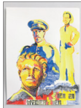
'Zien en wederzien toepassen', schets, 2017, David Bade.