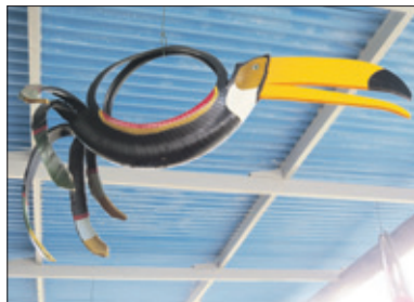
N naast de welbekende papegaai nu ook de beo.