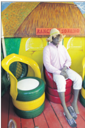
Drie stoelen op een rij voor het kunuku-huisje van Rancho Sobrino. Op de middelste zit een pop.