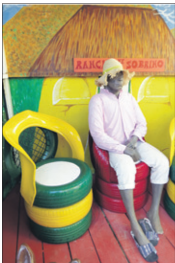
Drie stoelen op een rij voor het kunuku-huisje van Rancho Sobrino. Op de middelste zitelt een pop.