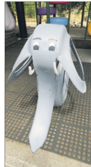
Een vriendelijk ogend olifantje.