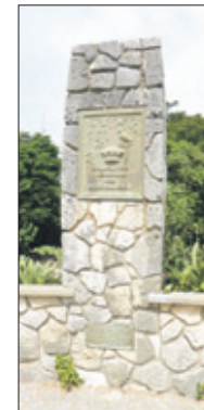
Gedenkplaat 50-jarig regeringsjubileum koningin Wilhelmina, brons, 1948, Wilhelmialaan.