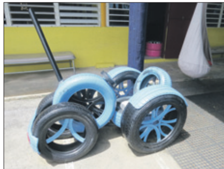
Een van de twee auto's in de speeltuin van Casa Cuna.

Voor meer informatie over 'Tur Kos Di Tayer', Siberie 16, Tera Kòrdi: telefoon 6798152 of 6772474.