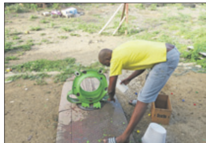
De laatste hand aan een kruk.