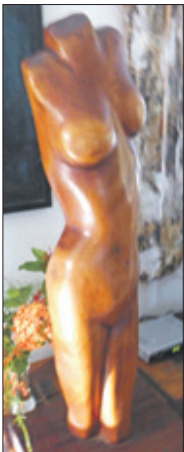
Torso, hout, René de Rooy, 1974, collectie Familie de Rooy.