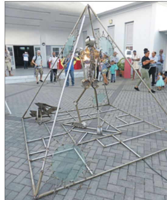
'Man of Steel', Giovanni Abath, mixed media, 1917, nog te zien bij NAAM.

Vele andere bedrijven hebben hun interieurs en of hof verfraaid met sculpturen: Deloitte, VanEps Kunnenan VanDoorne, het Antilliaans Dagblad en Vidanova om enkele te noemen. Op mijn omzwerpingen op het eiland ben ik de vuissten van Yu-