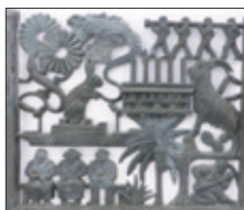
Bronzen reliëf van 'Lost Monument' van Gerrit Jan van der Veen uit 1934.