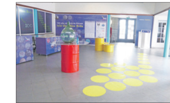
De entree van NAAM.